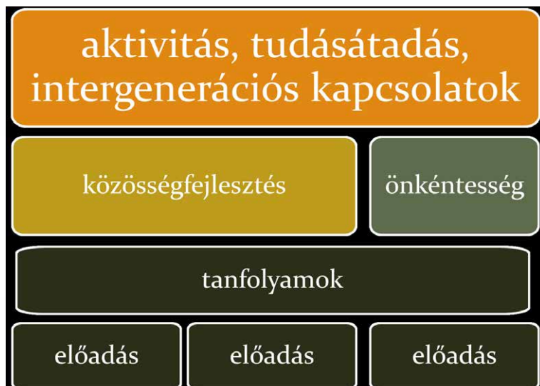
1. ábra: A Pécsi Szeniorakadémia képzési szerkezete

Az 1. ábra az akadémia tevékenységének szerkezetét ábrázolja. Működésünk alapját a rendszeres előadások, rendszeres találkozások adják, erre épülnek a tanfolyamok és egyéb rendezvények. Célunk az interaktivitás, az egymástól tanulás támogatása, az önkéntesség erősítése, a közösségfejlesztés. Az, hogy szenior hallgatóink önműködő tanulócsoportokat hozzanak létre, aktív tagjai legyenek a közösségnek, együtt hozzanak létre értékeket, legyenek tisztában saját értékeikkel és tudásukkal úgy, hogy ezt másokkal is megosztják.