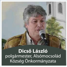
Dicső László polgármester, Alsómocsolád Község Önkormányzata